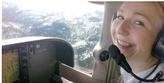
Drammen Flyklubb - Motorflyskolen

Eksamensdato: Valgfritt, tas ved en av Vegvesenets trafikkstasjoner